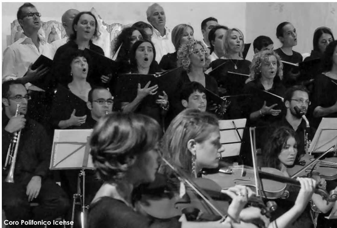
Coro Polifonico Icnese

Oggi la corale si presenta a questa nuova edizione della rassegna attenta a vivere con entusiasmo la propria evoluzione artistica musicale e aperta a future importanti collaborazioni.